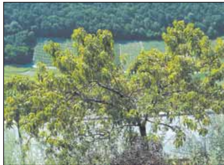
Surplombant un vignoble séduisant, le célèbre «pêcher de l'évêché» se dore paresseusement sous le soleil. BITTEL