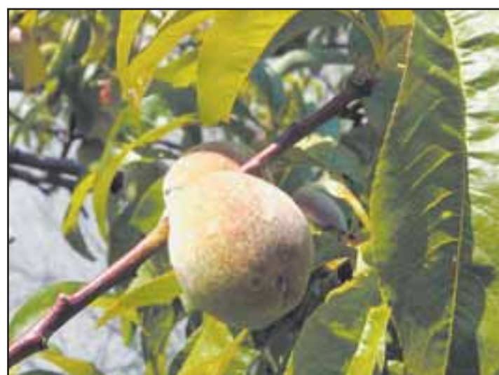
Début juillet, la pêche de vignes, veloutée à souhait, est encore loin d'atteindre sa pleine maturité. BITTEL